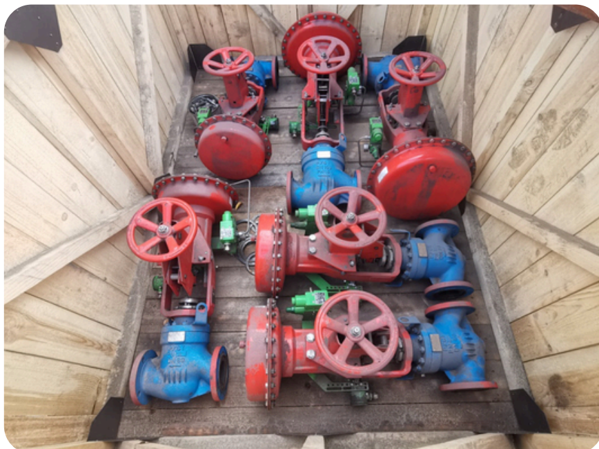
Клапан запорный с мембранным приводом тип РУСТ 310-1У1 Dn100 Pn15