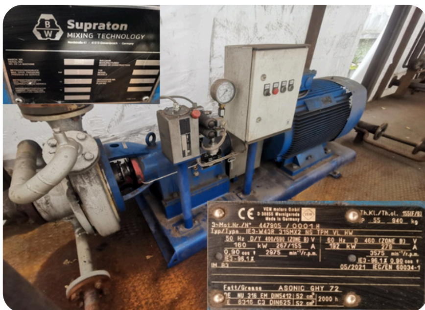
Коллоидная мельница Supraton mixing technology 449-5.03 (производство Германия)